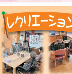
シ・アバウト&アンサンブルベガ様